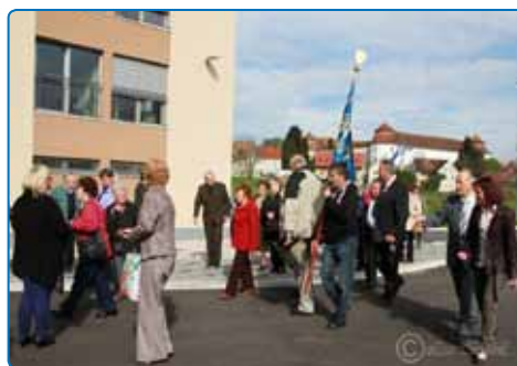
Medgeneracijske aktivnosti in druženje