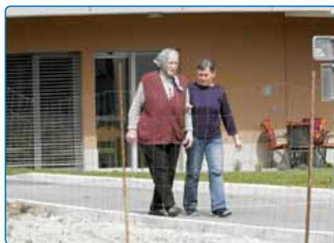
Sodelovanje svojcev pri sprehodih