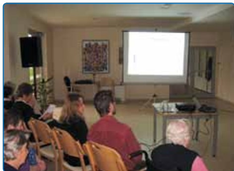
Predavanje Demenca naša realnost

Vabimo vas, da s svojimi predlogi obogatite vsebino na vseh tistih področjih, kjer vam bodo dodatna znanja omogočala lažje razumevanje. Spremljajte javne objave na oglasnih deskah, Recepciji in na spletni strani www.impoljca.si . Vse vsebine so brezplačne.