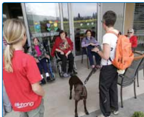
Programi za ciljne skupine - terapija z živalmi