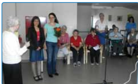
Zaključna prireditev bralnih skupin Lastovke in Mlade lastovke