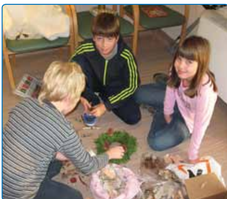
Ustvarjalna delavnica s prostovoljci - učenci OŠ Brestanica