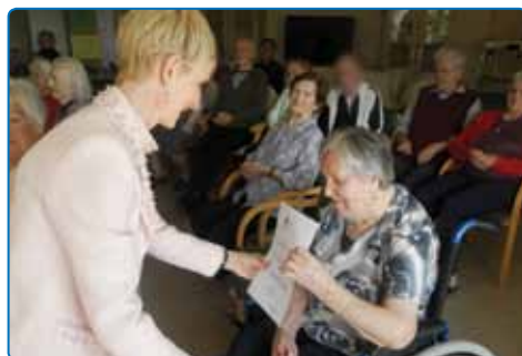
Priznanja bralcem podeljuje direktorica Knjižnice Brežice