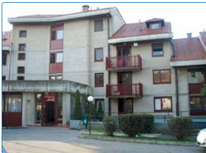
Star objekt DU Brežice na Prešernovi 13, Brežice

Dejavnost Doma se je 4. novembra 2013 na novo organizirala v najemnem objektu, na naslovu Dobovska cesta 8, Brežice, s 156 mesti.