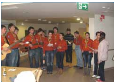
Skavti in betlehemska luč miru