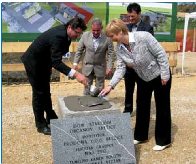
Položitev temeljnega kamna 14. 5. 2012