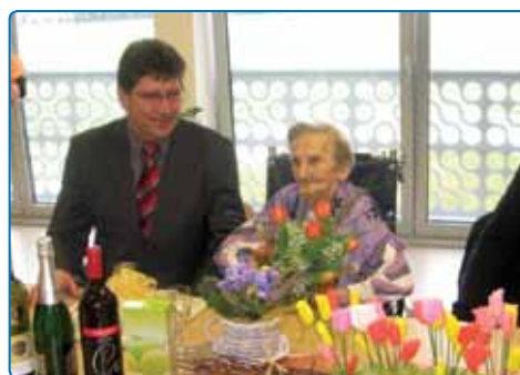
Praznovanje 101. rojstnega dne