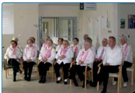
Prireditev Kulturni četrtek