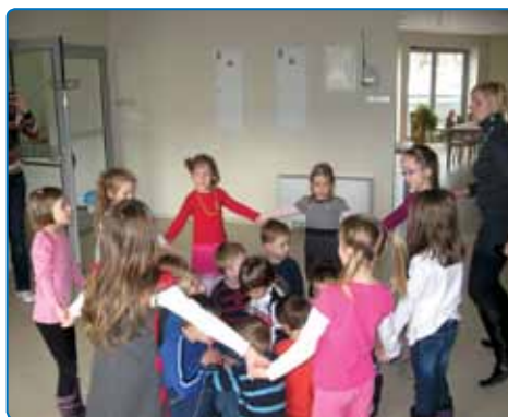
Sodelovanje z Vrtcem Mavrica Brežice