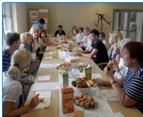
Srečanje prostovoljnih sodelavcev - izvajalcev brezplačnih medgeneracijskih aktivnosti za starejše