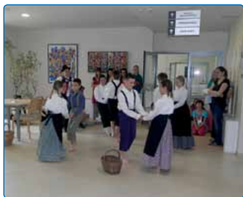
Sodelovanje z osnovnimi šolami

Nastaja mesečni koledar brezplačnih medgeneracijskih aktivnosti za starejše iz lokalne skupnosti. Mesečni koledar aktivnosti je objavljen na oglasnih deskah in dostopen na spletnem naslovu www.impoljca.si . Vljudno vas vabimo, da se nam pridružite.