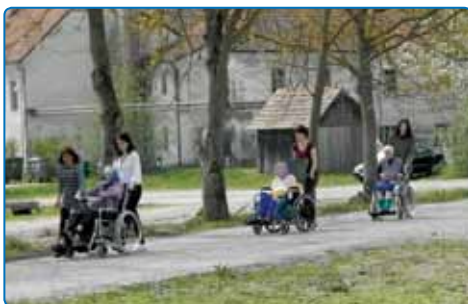
Dan za spremembe s prostovoljci iz Gimnazije Brežice

Poteka v okviru družabništva, individualno ali v skupini (pogovori, sprehodi, branje, spremstvo, druženje, igranje družabnih iger, prepevanje ...). V okviru srečanj stanovalcev in prostovoljcev se poleg družabništva in sožitja generacij izvajajo tudi ustvarjalne delavnice (izdelava voščilnic, okraskov, izdelkov ...), športne in plesne aktivnosti, pogovorne skupine in drugo.