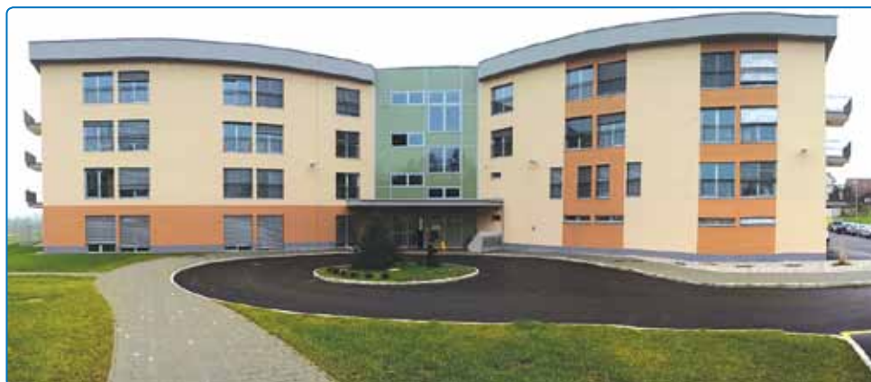
Nov objekt DU Brežice na Dobovski cesti 8, Brežice