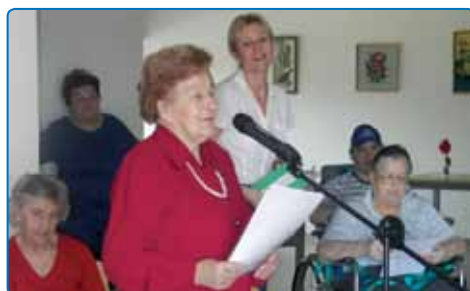
Predstavitve poezije in recitacij