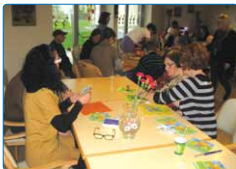
Klepet ob kavi s svojci enote Sava

Skupine za samopomoč svojcev delujejo po enotah. Srečanja so redna. Namen delovanja skupin je permanentna komunikacija, učenje, informiranje, reševanje stisk ter krepitev in razvijanje odnosov. Ohranjanje stikov s primarno socialno mrežo je obojestransko izrednega pomena za prenos informacij in dobrega počutja.