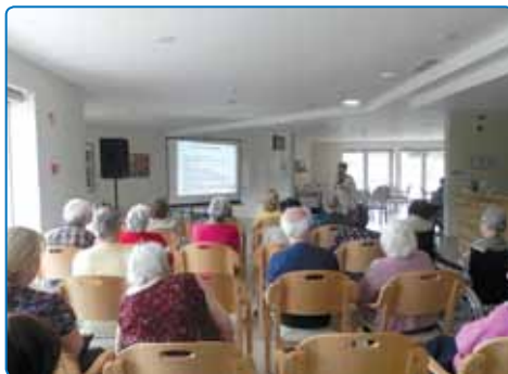
Predavanje o validaciji