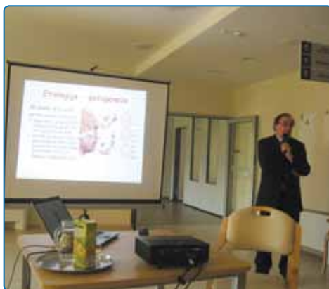
Predavanje o demenci