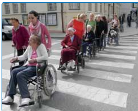
Programi za ciljne skupine - izlet v staro mestno jedro Brežic