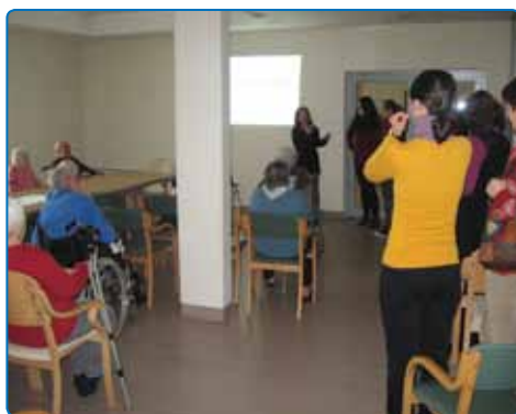
Usposabljanje in edukacija