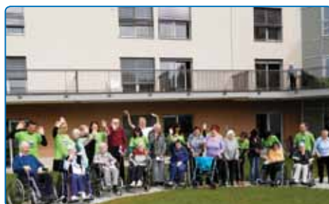
Druženje s prostovoljci iz podjetja Krka